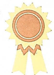
Kursledare: Rasmus Svärd. Leg Fysioterapeut